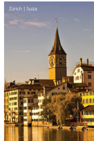
Zúrich | Suiza