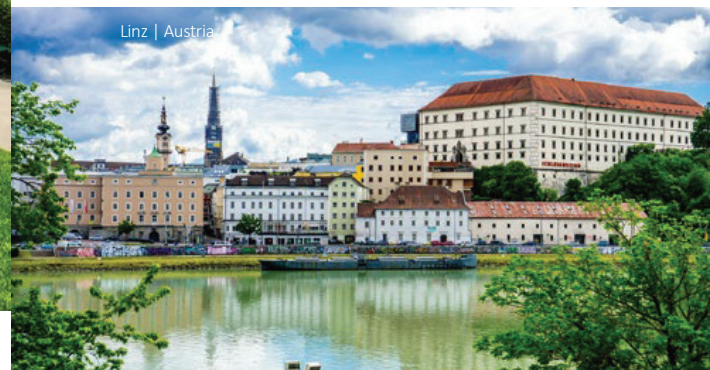
Linz | Austria

7 Praga - Múnich Por la mañana se acercará a la vida de Mozart en Praga. En el casco antiguo de la ciudad visitará la Torre de la Pólvora y la Plaza Vieja, dominada por el Ayuntamiento con su Reloj Astronómico, así como las impresionantes Iglesias de Tyn y de San Nicolás. Recorrerá el Puente de Carlos, donde puede apreciar una galería de estatuas barrocas con una hermosa vista al Castillo de Praga. ¡Ahora se entiende por qué Mozart dedicó toda una sinfonía a esta ciudad! Regreso a Múnich.