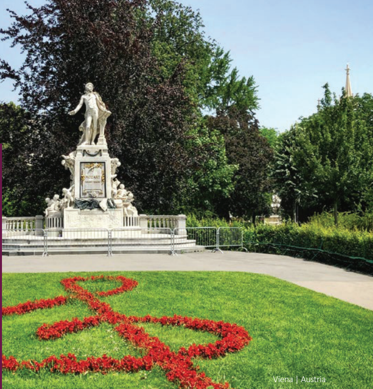
Viena | Austria

Obligatorio presentar licencia de conducir nacional e internacional de forma física (no digital). La tarjeta de crédito debe estar a nombre del conductor. No se aceptan tarjetas virtuales ni tarjetas de débito.