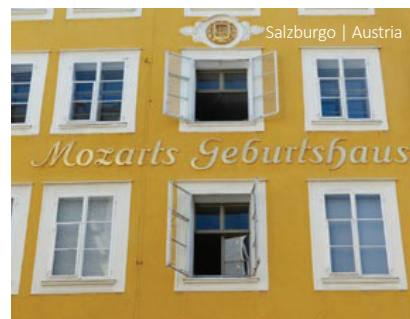
Salzburgo | Austria