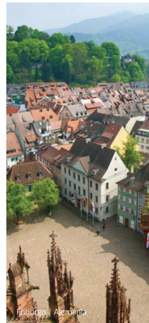
Friburgo | Alemania

Después del desayuno se hará una visita guiada de la ciudad. A continuación, salida hacia Frankfurt con una parada en la ciudad de Würzburg, que forma el límite norte de la "Ruta Romántica". Después de la visita a la ciudad de Würzburg continúa el viaje a Frankfurt. El tour finaliza en el Aeropuerto de Frankfurt alrededor de las 17:00 horas. Después parada en el hotel Mövenpick para los pasajeros con noches extras. Fin de nuestros servicios.