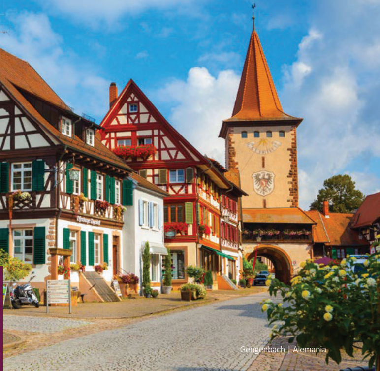
Gengenbach | Alemania