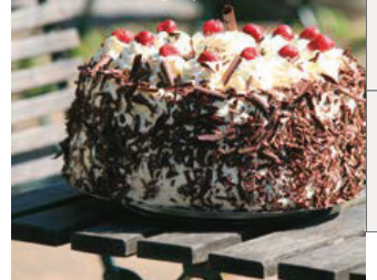
Pastel Selva Negra | Alemania